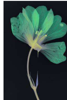
Suzanne Lafont. Nouvelles espèces de compagnie. Roman (détail)

Suzanne Lafont est née en 1949 à Nîmes. Son travail photographique se compose d'éléments empruntés aux domaines du théâtre, du cinéma, de la performance ou encore des sciences. Elle questionne l'évolution du végétal en milieu urbain.