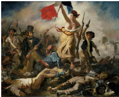
Eugène Delacroix, La liberté guidant le peuple , 1830, Huile sur toile, Paris, Musée du Louvre

La plupart des œuvres de Delacroix sont d'inspiration littéraire. Mais il a aussi exécuté des œuvres engagées souvent en rapport avec l'actualité, comme Les massacres de Scio , et des tableaux à thème religieux. Au cours d'un voyage en Afrique du Nord, en 1837, il fut l'un des premiers artistes à peindre l'Orient d'après nature. Il est également l'un des peintres officiels du Second Empire.