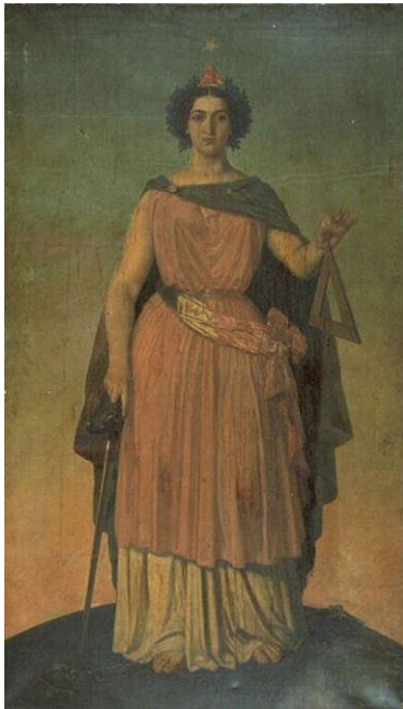
Pierre Édouard Lambert, La République de 1848 en pied , Huile sur toile, 1848, Bordeaux, Musée des Beaux-Arts

L'utilisation d'une femme (en pied ou en buste) comme symbole de la République française trouve son origine lors de la Révolution française.