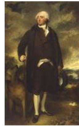
Sir Thomas Lawrence, Portrait de John Hunter , 1789-1790, Huile sur toile, Bordeaux, Musée des Beaux-Arts

À l'aube du XIX ème siècle, les voiliers marchands de plus de 1000 tonnes se multiplient.