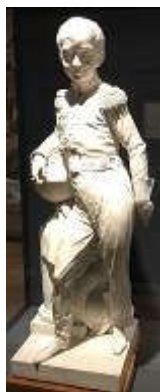
Manufacture de Sèvres, Pierre-Sébastien Guersant (sculpteur), Regnier (mouleur), Duc de Bordeaux , 1827, Biscuit, Bordeaux, MADD

L'abolition des corporations par la loi Le Chapelier du 14 juin 1791, constitue un bouleversement majeur. Le décret annonce qu'« il sera libre à tout citoyen d'exercer tout métier qu'il jugera bon en achetant une patente. »