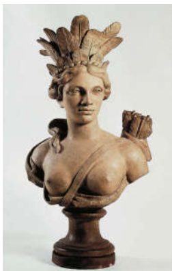
Anonyme, L'Amérique , terre cuite, 4 ème quart du XVIII ème siècle, Bordeaux, MADD

Ce buste en terre cuite, représentation allégorique de l'Amérique, occupe une place centrale dans le musée des Arts décoratifs et du design où il orne la cheminée du Salon de compagnie. Son auteur est inconnu, probablement un artiste français, dans la deuxième moitié, voire le dernier quart du XVIII ème siècle.