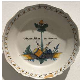
Manufacture de Nevers, Assiette à décor révolutionnaire , vers 1790, Faïence, Bordeaux, MADD

En littérature et Beaux-Arts : Une allégorie est un mode d'expression consistant à représenter une idée abstraite, une notion morale par une image ou un récit où souvent (mais non obligatoirement) les éléments représentés correspondent trait pour trait aux éléments de l'idée représentée.