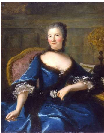
Marianne Loir (1715-1781), Portrait de Gabrielle Emilie Le Tonnelier de Breteuil, marquise du Châtelet , 1745, Huile sur toile, Bordeaux, Musée des Beaux-Arts

Comme le montre le phénomène des Salons et des cabinets scientifiques, le siècle des Lumières est une période d'intense vulgarisation scientifique. Les progrès réalisés dans tous les domaines n'intéressent pas uniquement les savants mais aussi la bonne société française. C'est pour répondre à ce goût généralisé pour la connaissance que sont menées des entreprises comme la rédaction de L'Encyclopédie sous la direction de Diderot et d'Alembert ou encore la traduction de l'ouvrage de Newton, Philosophiæ Naturalis principia mathematica , par Madame du Châtelet en 1756 (publication posthume).