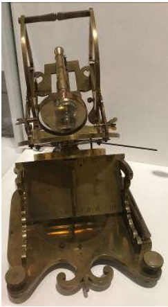
Rousseau, Cadran équinoxial avec canon de midi et cadran polaire universel , 1783, Acier, alliage cuivreux, verre, Paris, Musée du Louvre

Ce cadran solaire était équipé d'un canon qui se mettait en action lorsque le soleil était à son zénith et qu'un de ses rayons traversait la loupe placée dessous.