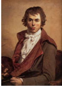
Jacques-Louis David, Portrait , 1794, Huile sur toile, Paris, Musée du Louvre

Jacques-Louis David (1748-1825) est un peintre et député de la Convention française. Il est considéré comme le chef de file du mouvement néo-classique, dont il représente le style pictural. En parallèle à sa carrière artistique, il entame une activité politique en devenant député à la Convention et organisateur des fêtes révolutionnaires. Son engagement l'amène à voter la mort du roi Louis XVI, et son soutien pour Maximilien de Robespierre lui vaudra, à la chute de celui-ci, d'être emprisonné lors de la réaction thermidorienne. Ses activités politiques prennent fin sous le Directoire, il devient membre de l'Institut et se prend d'admiration pour Napoléon Bonaparte. Il se met à son service quand celui-ci accède au pouvoir impérial, et il réalise pour lui sa plus grande composition Le Sacre de Napoléon . Sous la Restauration, son passé de révolutionnaire régicide et d'artiste impérial lui vaut d'être exilé. Il se réfugie à Bruxelles et continue jusqu'à sa mort en 1825 son activité artistique.