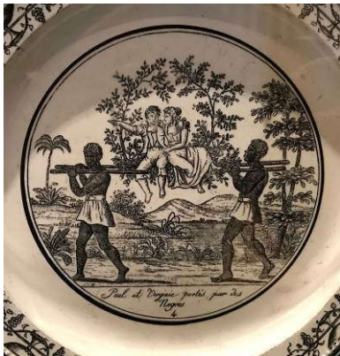
Manufacture de Choisy-Le-Roi, Service Paul et Virginie, Paul et Virginie portés par des Nègres , vers 1830, faïence, Bordeaux, MADD

Le combat pour l'abolition de l'esclavage, qui occupait les esprits depuis l'établissement des colonies du Nouveau Monde, prend de l'ampleur au commencement de la période révolutionnaire. Non sans mal, ce mouvement aboutit au décret d'abolition de l'esclavage en février 1794, décret qui ne connaît qu'une application limitée. Sous le Consulat, la paix d'Amiens, signée en 1802 alors que la France est engagée dans une campagne à Saint-Domingue, revient sur ces acquis révolutionnaires. De