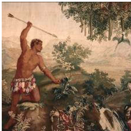
Manufacture Royale des Gobelins d'après François Desportes, Tenture des Anciennes Indes : le cheval rayé mordu par un tigre (détail), vers 1690, Laine, Paris, Musée du Louvre

Les grandes découvertes de la Renaissance – notamment l'Amérique par Christophe Colomb en 1492, les Indes par Vasco de Gama en 1497, le Canada par Magellan en 1519 – révèlent aux Européens qu'ils ne sont pas seuls sur Terre et qu'il existe, ailleurs, d'autres peuples, aux modes de vie radicalement différents du leur. Dès lors se développe le mythe du « bon sauvage », un homme