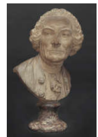
Jean Baptiste II Lemoyne (1704 -1778), Buste de Jean-Jacques Rousseau , 1768 (vers), terre cuite, Bordeaux, Musée des Beaux-Arts

(1712-1778) est un écrivain, philosophe et musicien genevois francophone. Orphelin de mère très jeune, sa vie est marquée par l'errance.