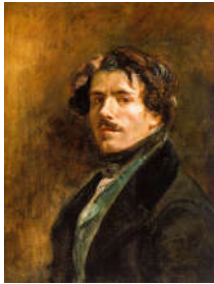
Eugène Delacroix, Autoportrait au gilet vert , 1837, Huile sur toile, Paris, Musée du Louvre

Eugène Delacroix (1798-1863) a abandonné la tradition académique en sacrifiant le dessin au profit de la couleur. Ses œuvres font de lui le chef du courant romantique en peinture.