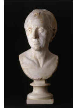
Félix Lecomte (1737-181), Jean Le Rond d'Alembert , 1774, marbre, Paris, Musée du Louvre

Jean Le Rond d'Alembert (1717-1783) est en 1744 l'inventeur de cette nouvelle branche des mathématiques, le calcul aux dérivées partielles, qui introduit des fonctions arbitraires.