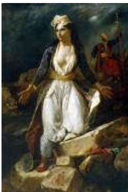
Eugène Delacroix (1798-1863), La Grèce sur les ruines de Missolonghi , huile sur toile, 1826, Bordeaux, Musée des Beaux-Arts