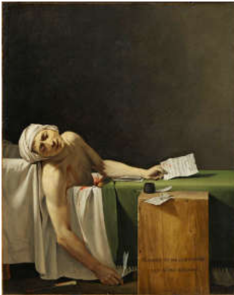
Jacques-Louis David (1748-1825), Marat assassiné , 1794, huile sur toile, Paris, Musée du Louvre

Jacques-Louis David (1748-1825) est un peintre et député de la Convention française. Il est considéré comme le chef de file du mouvement néo-classique, dont il représente le style pictural. En parallèle à sa carrière artistique, il entame une activité politique en devenant député à la Convention et organisateur des fêtes révolutionnaires. Son engagement l'amène à voter la mort du roi Louis XVI, et son soutien pour Maximilien de Robespierre lui vaudra, à la chute de celui-ci, d'être emprisonné lors de la réaction thermidorienne. Ses activités politiques prennent fin sous le Directoire, il devient membre de l'Institut et se prend d'admiration pour Napoléon Bonaparte. Il se met à son service quand celui-ci accède au pouvoir impérial, et il réalise pour lui sa plus grande composition Le Sacre de Napoléon . Sous la Restauration, son passé de révolutionnaire régicide et d'artiste impérial lui vaut d'être exilé. Il se réfugie à Bruxelles et continue jusqu'à sa mort en 1825 son activité artistique.