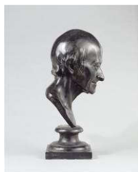
Jean-Antoine Houdon (1741-1828), Voltaire , 1778, bronze, Paris, Musée du Louvre

François-Marie Arouet, dit Voltaire (1694-1778), est un écrivain et philosophe français qui a marqué le XVIII ème siècle.