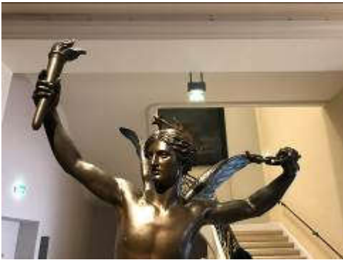
Auguste-Alexandre Dumont (1801-1884), Le Génie de la liberté (détail), 1836, Bronze, Paris, Musée du Louvre

Ce Génie de la Liberté est une réplique en demi-taille de la statue qui surplombe la Colonne de Juillet, place de la Bastille à Paris, monument dédié aux victimes de la Révolution de 1830. Aérien, il semble planer, portant dans la main droite un flambeau et dans la gauche les chaînes brisées du despotisme. La liberté est rarement figurée par une figure masculine.