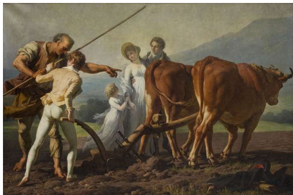
François André Vincent (1746-1816), L'Agriculture , 1798, huile sur toile, Bordeaux, Musée des Beaux-Arts

Jean-Jacques Rousseau se défendant de la critique