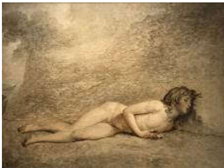
Jacques-Louis David, La Mort du jeune Bara , Huile sur toile, 1794, Avignon, Musée Calvet

La Mort du jeune Bara est une peinture inachevée de Jacques-Louis David peinte pendant la période révolutionnaire. Le tableau représente Joseph Bara jeune tambour de l'armée républicaine, tué par des vendéens. Il est érigé en héros et martyr de la Révolution, l'œuvre de David participe à cette célébration.