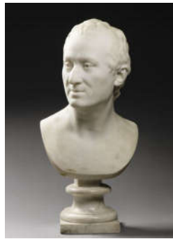
Jean-Antoine Houdon (1741-1828), Denis Diderot , 1775, marbre, Paris, Musée du Louvre

Denis Diderot , né le 5 octobre 1713 à Langres et mort le 31 juillet 1784 à Paris, est un écrivain, philosophe et encyclopédiste français des Lumières. Diderot est reconnu pour son érudition et son esprit critique.