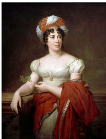
Marie-Éléonore Godefroid d'après François Gérard, Anne-Louise-Germaine Necker, baronne de Staël-Holstein , 1800-1810, Huile sur toile, Versailles, Musée national des châteaux de Versailles et de Trianon

Émilie du Châtelet (1706-1749) est une mathématicienne, femme de lettres et physicienne française. Elle a contribué non seulement à populariser en France l'œuvre physique de Leibniz, mais a aussi démontré par l'expérience que l'énergie cinétique (appelée à l'époque « force vive »), était bien proportionnelle, comme il l'avait formulé, à la masse et au carré de la vitesse. Voltaire (1694-1778), avec qui elle entretient une liaison de quinze ans, l'encourage à poursuivre ses recherches scientifiques. Elle a traduit les Principia Mathematica d'Isaac Newton (1642-1727). Elle tient dans sa main un compas, outil de géométrie cosmique.