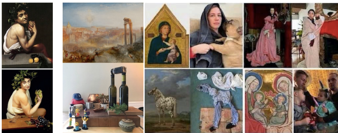
Le défi du Getty Museum a incité les internautes confinés à créer leurs versions d'œuvres d'art célèbres / Image crédit : Twitter/Getty Museum A gauche, en haut : Le Caravage, Le Jeune Bacchus malade , 1593-94, Huile sur toile ©galleriaborghese / En bas : Cindy Sherman, Untitled #224 (History Portraits/Old Masters) , 1990, photographie cibachrome

https://www.instagram.com/gettymuseum/ :