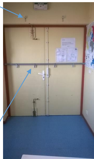
Barres positionnées pour portes doubles

Ces prises de vue sont transmises à titre d'exemple. Il existe de nombreuses solutions ou autre dispositif permettant le renforcement du blocage des portes.