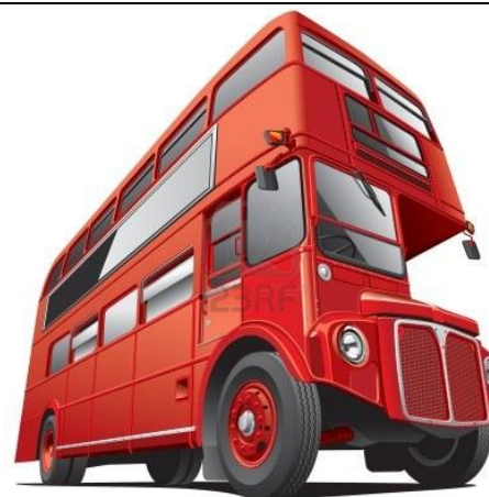
Mascotte de la classe