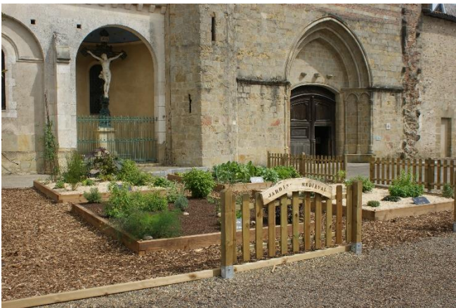
Parvis et porche de la cathédrale Saint Jean-Baptiste.

Possibilité d'étudier : l'art roman, l'art gothique, définition d'une cathédrale, le plan d'une église, la construction avec les marques des tailleurs de pierre, étude des peintures et du bestiaire (l'élève pourra créer son animal légendaire...)